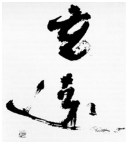
Maa - calligraphie: Place, Space, Void

Er zal gewerkt worden met ademhalings- centreringstechnieken, en ruimtelijke oefeningen geïnspireerd op japanse krijgskunsten (aikido, waraku) en oosterse meditatie- en helingstechnieken (Zen, Shiatsu, Seiki, Chinese Traditionele Geneeskunde).